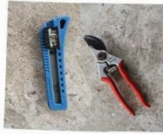
มีด /กรรไกร