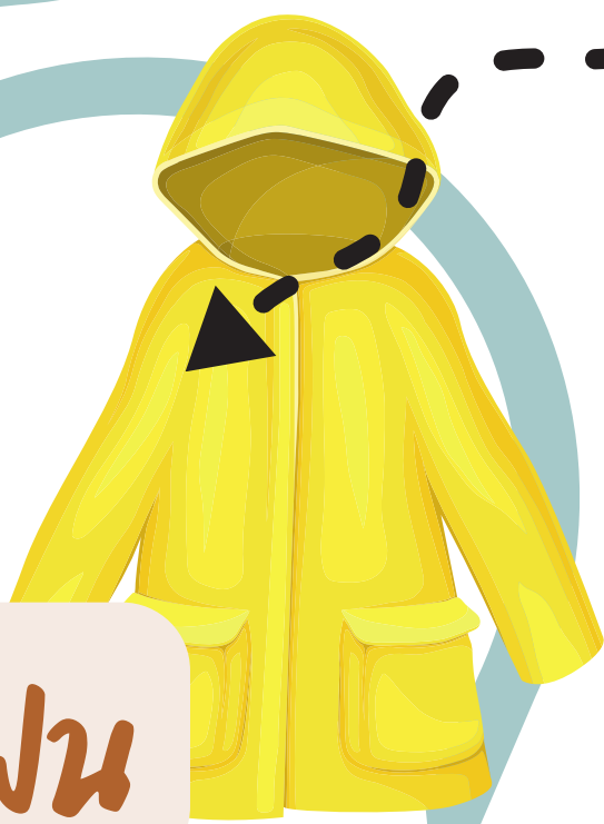
เสื้อกันฝน